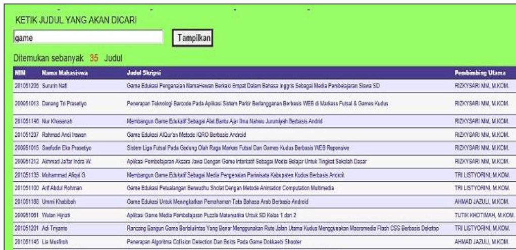
Gambar Pengujian validasi judul skripsi

Form ini digunakan untuk memvalidasi judul skripsi yang sudah dilakukan oleh mahasiswa lain. Untuk melakukannya cukup diketik kata kuncinya sehingga sistem akan menampilkan judul yang telah dikerjakan oleh mahasiswa sebelumnya. Form ini mempermudah komite skripsi maupun mahasiswa dalam memilih judul yang akan diambil sebagai bahan referensi mahasiswa.