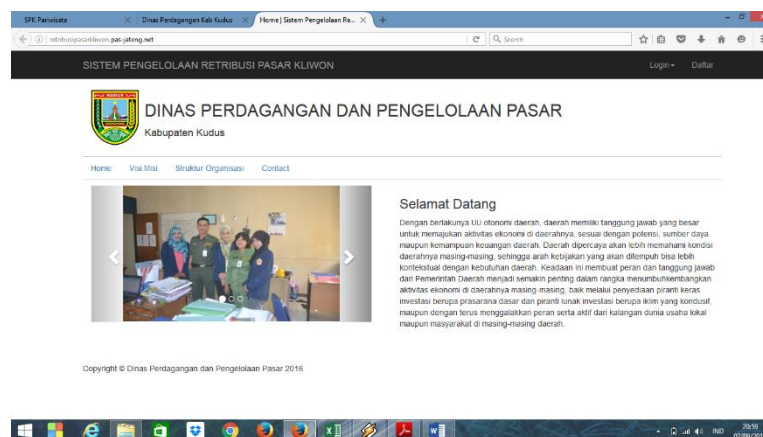
Gambar 2. Sistem pengelolaan retribusi pasar kliwon

Pengembangan teknologi terapan yang telah dilakukan adalah dengan membuat software yang dibutuhkan oleh masyarakat, adapun software yang telah dibuat adalah : Sistem pengelolaan retribusi pasar kliwon, sistem informasi pendataan harga pada dinas perdagangan, sistem informasi rawat jalan puskesmas