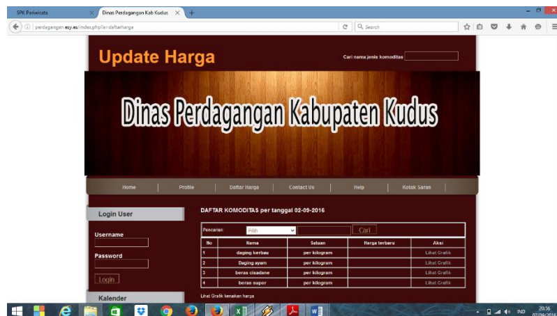
Gambar 3. Sistem informasi pendataan harga pada dinas perdagangan