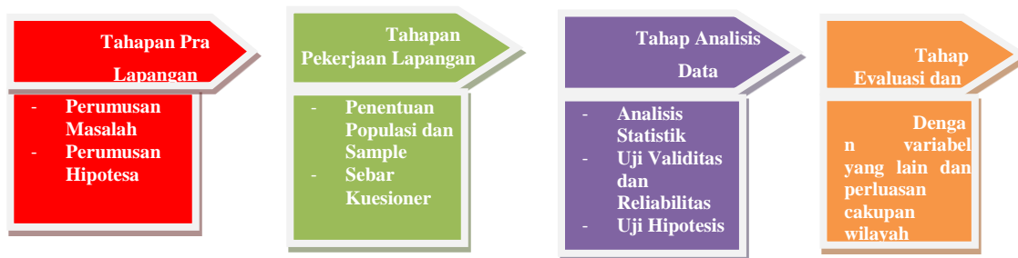
Gambar III.1 Road Map Penelitian

Road map penelitian dilakukan pada Dinas Pertamanan dan Pemakaman Kota Administrasi Jakarta Utara.