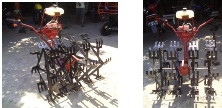
Gambar 1.3. Alat pengendalian gulma berpengerak motor yang perlu direkayasa agar lebih memenuhi harapan petani

Mesin pengendali gulma adalah salah satu solusi yang dapat diberikan pada petani, khususnya petani padi. Mesin ini adalah hasil modifikasi yang dilakukan terhadap alat landak (bahasa Jawa, red) yang masih mengandalkan tenaga manusia. Dengan memanfaatkan motor bensin stasioner dan pemindah daya dari mesin potong rumput panggul maka sorok yang semula bertenaga manusia menjadi bertenaga motor bakar. Mesin pengendali gulma yang bertenaga motor bakar yang telah dibuat pada kegiatan IbM 2015 sudah diserahkan kepada Kelompok Tani Mbangun Coro Desa Jati, Jaten, Karanganyu. Adapun bentuk mesin pengendali gulma tersebut seperti terlihat pada gambar 1.3 di bawah ini.