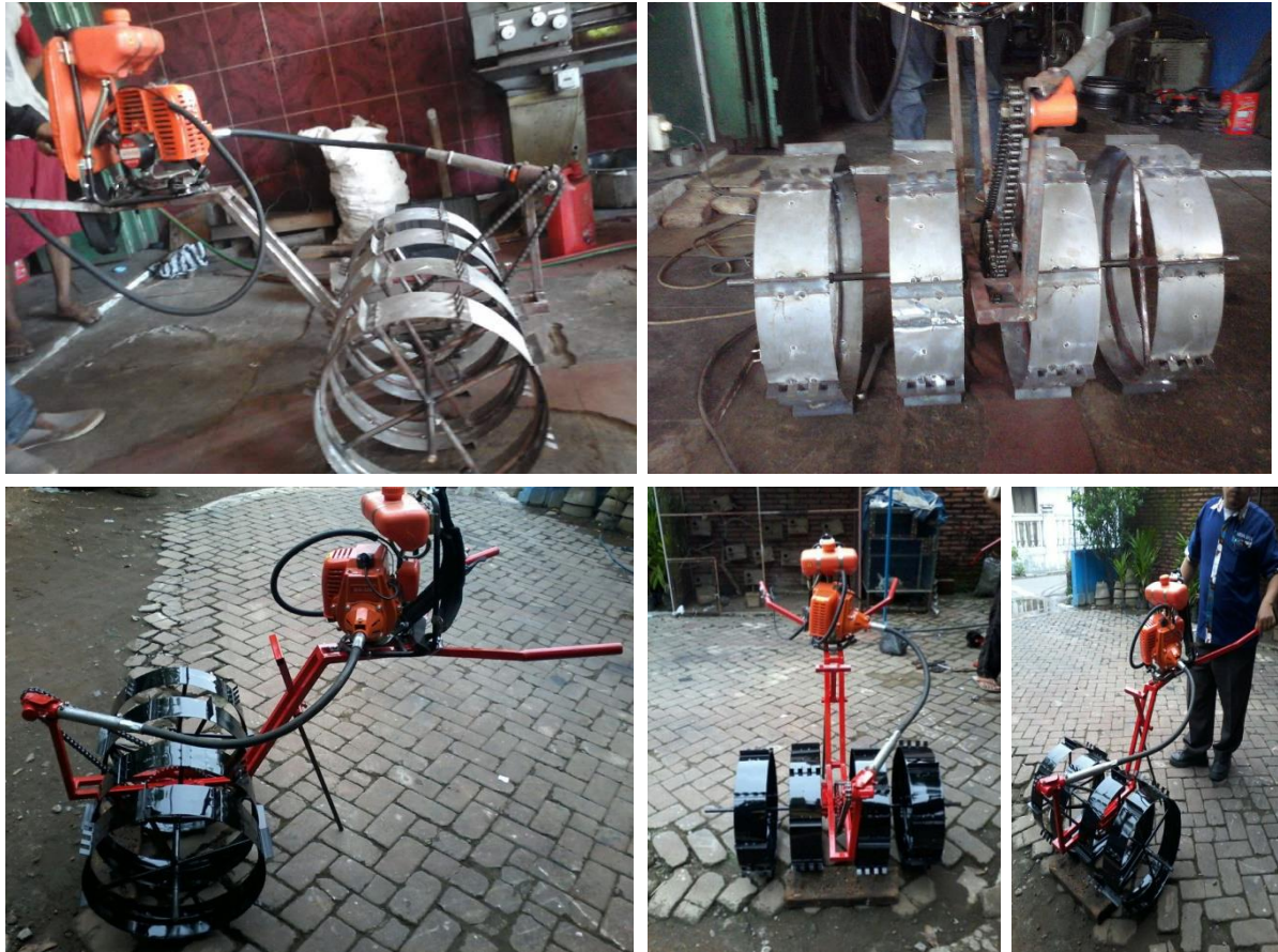
Gambar 2.2. Mesin pengendali gulma hasil redesain