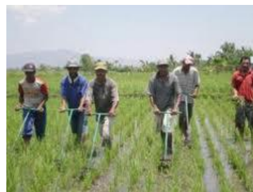
Gambar 1.1. Proses pengendalian gulma

Akhirnya pengendalian rumput dan ilalang ketika usia tanaman padi masih muda adalah menjadi sangat penting, dimana sering dilakukan dengan menggunakan landak (bahasa jawa, red) atau dengan tangan (mencabut). Pengendalian ini dilakukan dua kali dalam kurun waktu tiga bulan, ketika usia tanaman padi dua minggu dan enam minggu (setelah pemupukan), hal ini menguntungkan bagi buruh tani apalagi jika dilakukan diareal yang luas dan memakan waktu berhari-hari. Tetapi tidak demikian dengan petani dan konsumen beras, karena beban biaya tersebut akan ditanggung konsumen secara tidak langsung dengan naiknya harga beras.