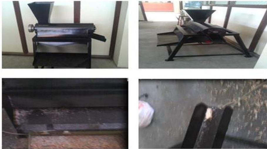
Gambar 2. Mesin pemipil jagung

Beberapa kelemahan tersebut adalah (1) mesin ini bebannya terlalu berat, (2) mesin ini belum otomatis yaitu operator.