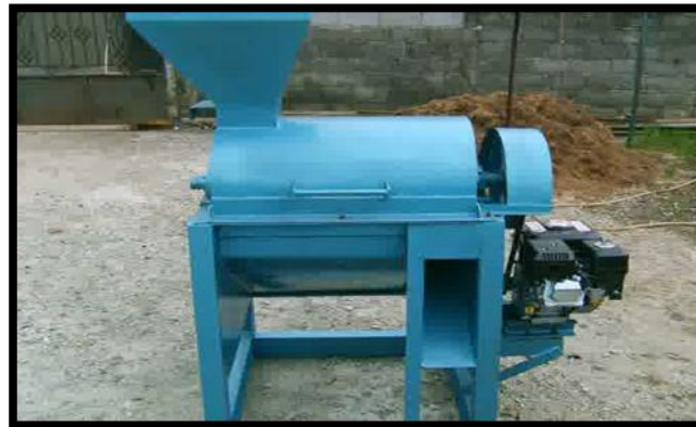
Gambar 5. Mesin penepung dengan sistem hammer mill

Adapun fungsi mesin penepung seperti pada gambar 5 diatas untuk menghancurkan bongkahan benda keras menjadi kristal-kristal atau tepung sesuai dengan yang diinginkan. Mesin ini bertipe : PPPS-1m