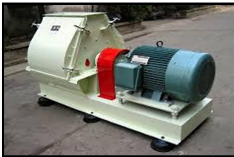
Gambar 3. Mesin hammer mill penepung

Adapun prinsip kerjanya, yaitu : bahan baku yang dimasukkan ke dalam mesin selanjutnya akan dibawa oleh sebuah pelat ke bagian penghancuran. Setelah bahan baku dihancurkan, lantas kemudian bahan pun akan dipotong dengan kecepatan yang sangat tinggi sehingga menjadi tepung. Proses ini juga menimbulkan tekanan udara di dalam akan mengalir keluar. Dengan kata lain bahan baku yang berupa tepung akan terbang keluar melewati saringan. Bahan yang masih berukuran besar akan diproses kembali hingga berbentuk tepung halus.