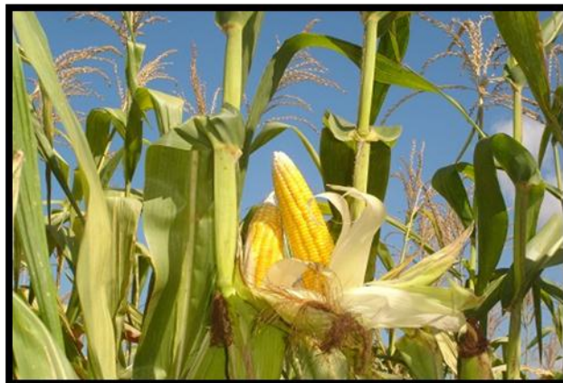
Gambar 1. Tanaman jagung

Jagung ( zea mays l ) seperti pada gambar 1 merupakan salah satu tanaman pangan dunia yang terpenting, selain gandum dan padi. Selain sebagai sumber karbohidrat utama di Amerika Tengah dan Selatan, jagung juga menjadi alternatif sumber pangan di Amerika Serikat. Penduduk beberapa daerah di Indonesia (misalnya di Madura dan Nusa Tenggara) juga menggunakan jagung sebagai makanan pokok. Selain sebagai sumber karbohidrat, jagung juga ditanam sebagai pakan ternak (hijauan maupun bongkolnya), diambil minyaknya (dari biji), dibuat tepung (dari biji, dikenal dengan istilah tepung jagung atau maizena), dan bahan baku industri (dari tepung biji dan tepung bongkolnya). Bongkol jagung kaya akan pentosa, yang dipakai sebagai bahan baku pembuatan furfural. Jagung yang telah direkayasa genetika juga sekarang ditanam sebagai penghasil bahan farmasi.