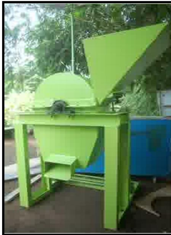
Gambar 4. Mesin penghancur ( hammer mill )

Mesin pada gambar 4 diatas berfungsi untuk menghancurkan berbagai bahan keras. Adapun spesifikasi mesin ini adalah sebagai berikut :