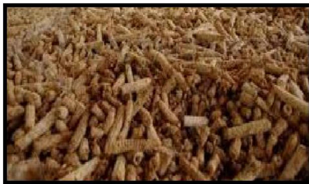
Gambar 2. Bongkol jagung kering