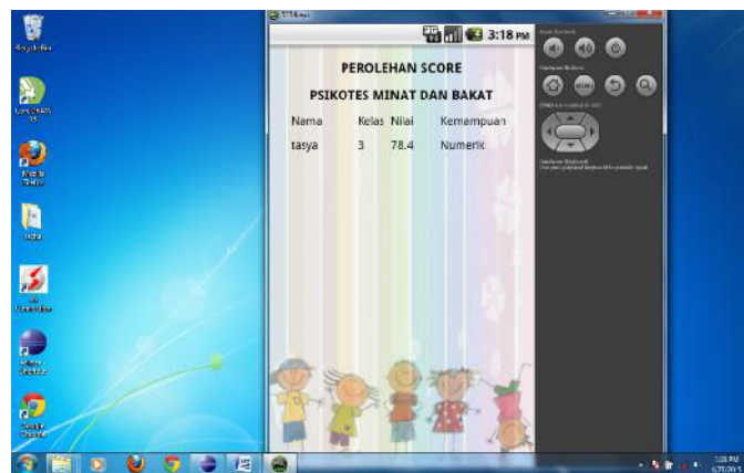
Gambar 9. Tampilan Hasil Perolehan Score Aplikasi

Jika pengguna telah menyelesaikan sembilan subtest yang ada, maka tampilan aplikasi akan seperti yang ditunjukkan pada Gambar 9. Dengan menampilkan nama pengguna, kelas, nilai serta kemampuan yang dimiliki berdasarkan hasil tes yang telah dikerjakan.