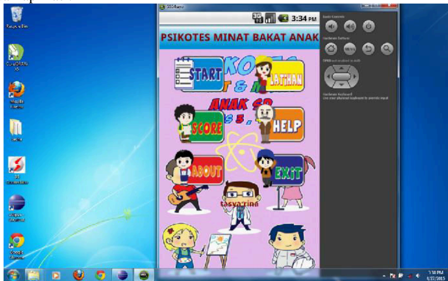
Gambar 6. Tampilan Awal Aplikasi Bakat Minat SD Kelas 3,4,5

menu HELP untuk petunjuk aplikasi, menu ABOUT untuk pengembang aplikasi, dan meni EXIT untuk keluar dari aplikasi.