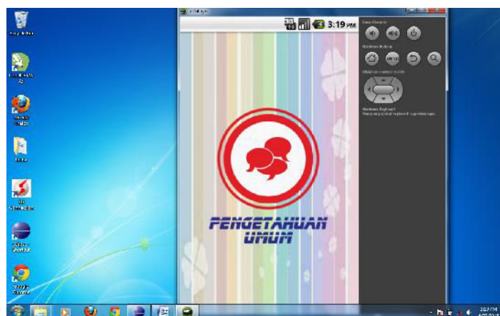
Gambar 10. Tampilan Latihan soal Aplikasi Bakat Minat SD Kelas 3,4,5

Gambar 10 merupakan tampilan aplikasi untuk menu latihan soal. Terdapat sembilan sub tes dimulai dari Pengetahuan Umum dan seterusnya. Untuk pindah ke subtest lain dapat dilakukan dengan menggeserkan layar kekanan, ataupun kekiri.