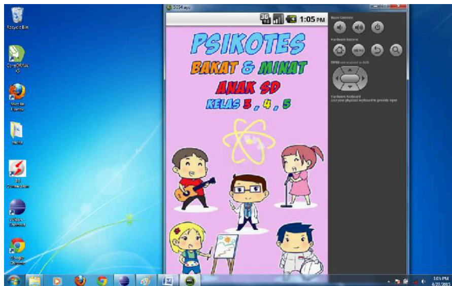
Gambar 5. Tampilan Loading Aplikasi Bakat Minat SD Kelas 3,4,5

Hasil implementasi sistem dapat dilihat pada Gambar 5 sampai dengan Gambar 10. Dimulai dari tampilan awal sampai hasil akhir penentuan hasil tes. Gambar 5 merupakan tampilan awal aplikasi, dimana akan ada beberapa detik untuk loading. Warna background aplikasi dominan pink , mengingat warna pink merupakan warna yang lembut dan digemari oleh kebanyakan anak-anak.