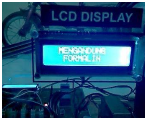
Gambar 3. LCD saat menampilkan hasil identifikasi “Mengandung Formalin”

LCD akan menampilkan hasil deteksi dengan menampilkan tiga kondisi pendeteksian; 1) “Mengandung Formalin” apabila sampel bahan makanan yang dideteksi ada formalin. 2) “Tidak Mengandung Formalin” apabila sampel bahan makanan tidak mengandung formalin, dan 3) “Belum Teridentifikasi” apabila sampel mendeteksi gas selain formalin dan belum ter-learning-kan di program Jaringan Syaraf Tiruan yang dibuat.