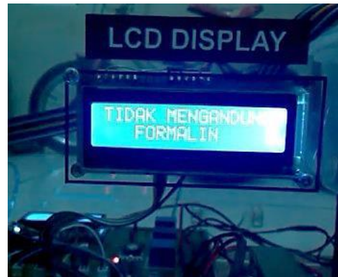
Gambar 4. LCD saat menampilkan hasil identifikasi “Tidak Mengandung Formalin”