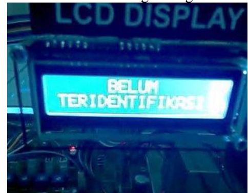
Gambar 5. LCD saat menampilkan hasil identifikasi “Belum Teridentifikasi”