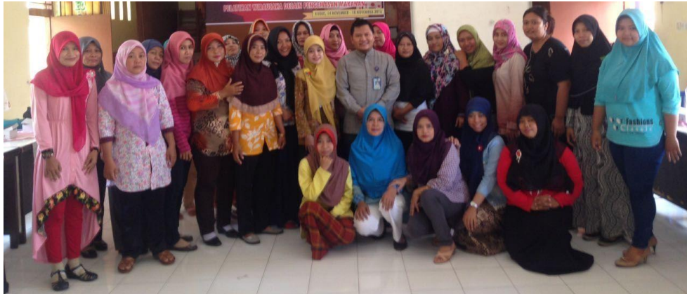
Gambar 3 Pelatihan hari pertama

Pelatihan terhadap user telah dilakukan pada tanggal 4-5 Desember 2019 (gambar 3 dan gambar 4).