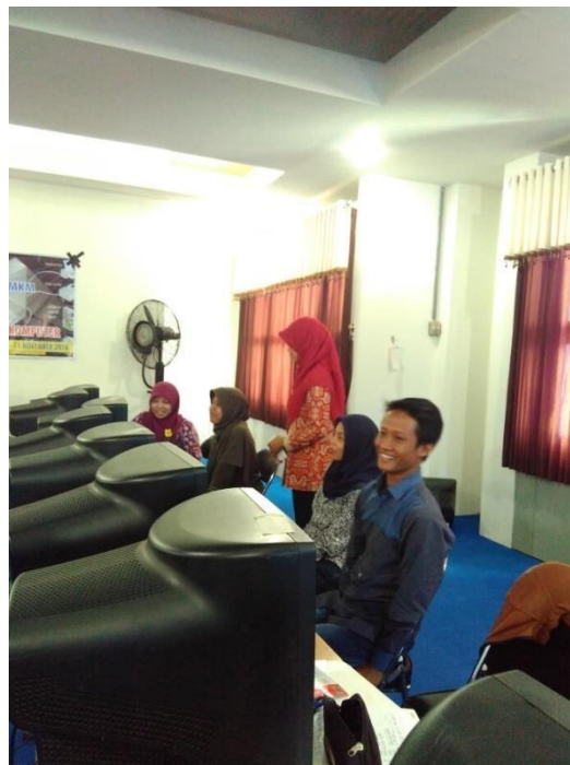
Gambar 4 Pelatihan hari kedua