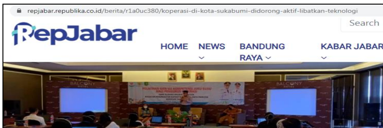
Gambar 1. Pembukaan Kegiatan Pelatihan oleh Walikota Sukabumi

Dalam kegiatan yang dilaksanakan selama dua hari, Kepala Diskumindag Kota Sukabumi Ayi Jamiat mengamanahkan yaitu keseluruhan jumlah unit koperasi adalah 332 yang ada di Kota Sukabumi, hanya terdapat 200 unit yang aktif. Diharapkan unit koperasi lainnya yang masih pasif, dapat kembali beroperasi pada masa pandemik, dan selanjutnya harapan untuk peserta yang mengikuti kegiatan pada kesempatan ini, bisa mengoptimalkan ilmu yang didapat pada kegiatan penyusunan laporan keuangan Koperasi sehingga dapat mempraktikkan pada unit koperasi masing-masing.