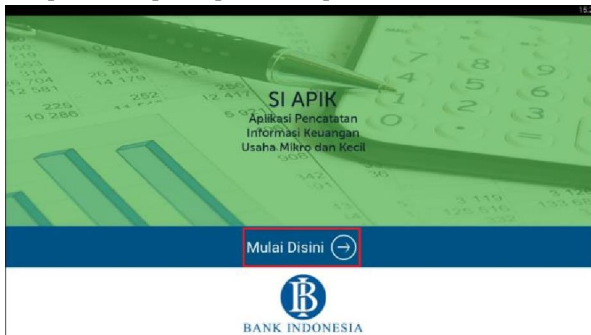
Gambar 1. Tampilan awal aplikasi si apik

yang dipergunakan untuk kegiatan operasional, data satuan terkecil barang yang digunakan untuk transaksi, data kas yang dimiliki badan usaha yang berbentuk valas, data saldo yang sudah ada pada saat dimulainya pencatatan transaksi keuangan. Tampilan awal aplikasi si apik dapat dilihat pada Gambar 1.