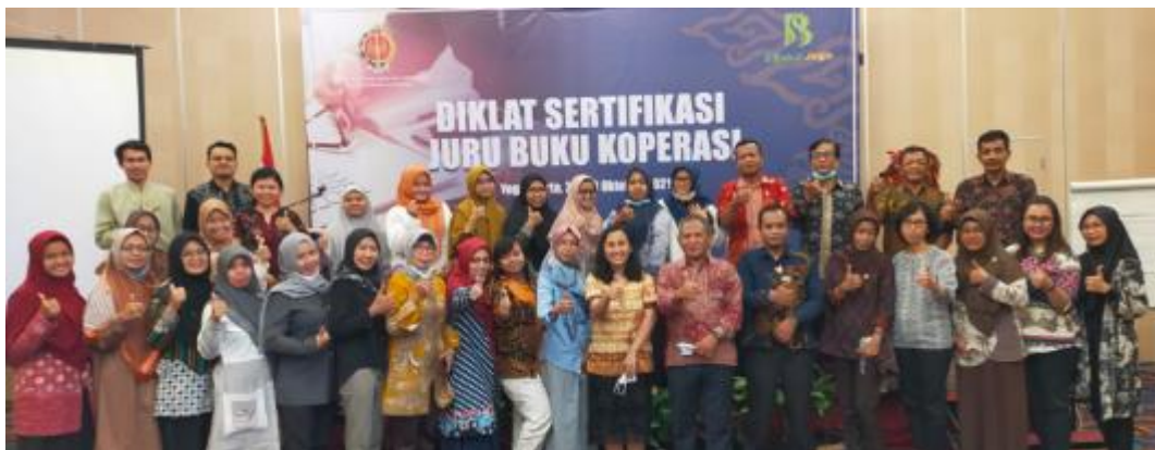
Gambar 3. Foto Bersama Peserta Group B

Peserta pelatihan yang dilibatkan dalam kegiatan ini adalah pemilik atau pelaksana pembukuan dan keuangan Koperasi di DI. Yogyakarta. Peserta dari kegiatan ini berjumlah 58 orang. Mereka datang melalui undangan secara resmi melalui Dinas Koperasi dan UMKM DI. Yogyakarta dan koperasinya belum menggunakan software khusus dalam pelaporan keuangannya.