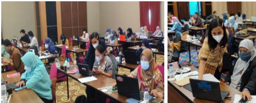
Gambar 4. Foto Pendampingan Pelatihan

Dalam pelaksanaan kegiatan pelatihan ini, para pelaksana pembukuan dan keuangan diberikan konsep dan wawasan mengenai bagaimana cara pengelolaan keuangan koperasi yang baik, dimulai dari bagaimana membuat anggaran keuangan koperasi, cara penyusunan dokumentasi keuangan dan penomorannya serta bagaimana penyusunan laporan keuangan dengan menggunakan aplikasi Ms. excel. Selama pelatihan, setiap selesai materi, para peserta diberikan pendampingan dalam penyusunan pengelolaan keuangan. Tindak lanjut dari kegiatan ini adalah para pemilik koperasi dapat mempraktekkan dalam kegiatannya sehari-hari tentang bagaimana cara menyusun dan membuat laporan keuangan koperasi sehingga pelaporan keuangan koperasi melalui Rapat Anggota Tahunan (RAT) dapat dilaksanakan tepat waktu.