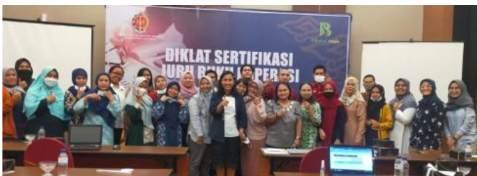
Gambar 2. Foto Bersama Peserta Group A

Kegiatan pengabdian ini dilaksanakan di Hotel Tara, Yogyakarta pada tanggal 21 s.d 23 Oktober 2021 dimulai pukul 08.30 – 17.00 dengan jumlah peserta sebanyak 58 orang. Kegiatan pengabdian masyarakat hari pertama dimulai dengan materi laporan keuangan koperasi dan penganggaran keuangan koperasi, serta materi tentang SAK EMKM untuk laporan keuangan koperasi. Dan Hari selanjutnya diberikan materi tentang pengenalan aplikasi Ms. Excel dan bagaimana pemanfaatan aplikasi Ms. Excel untuk pembuatan laporan keuangan koperasi.