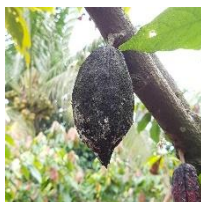
Black Pod Rod