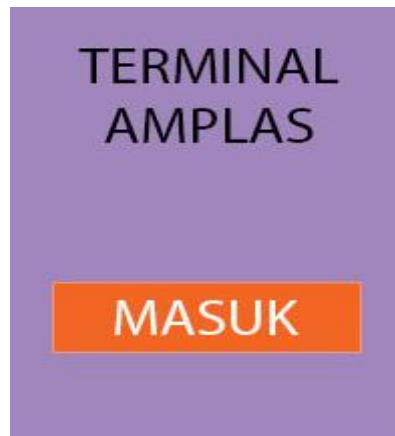
Gambar 2. Tampilan Utama

Analisis batasan masalah yang tergambar dalam konteks diagram adalah, aplikasi ini hanya dapat dipergunakan untuk calon penumpang yang ingin berangkat keluar kota dari kota Medan saja, dari luar kota ke Medan belum bisa, lalu belum adanya system antar jemput yang mana jika itu ada pasti akan membuat calon penumpang senang. Masih dipergunakannya titik kumpul sebagai berjalannya aplikasi dan soal pembayaran masih berbentuk manual cahc belum uang digital.