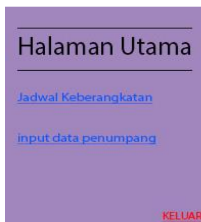
Gambar 3. Halaman Menu Utama Calon Penumpang